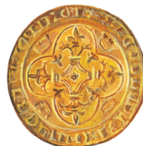
Revers d'un franc du XIV e siècle