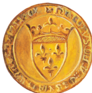
Avers d'un écu d'or du XV e siècle

Contrairement aux monnaies romaines ornées de " portraits " impériaux, les monnaies médiévales représentent rarement et tardivement l'effigie du roi. Sur l'avvers, c'est le nom du souverain qui est inscrit, étroitement associé à la croix. Sur le revers est gravé le symbole de l'atelier royal émetteur.