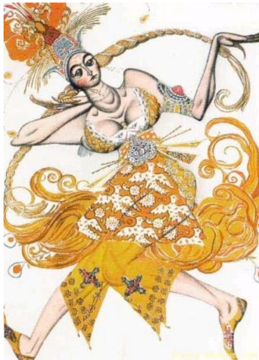
Projet de costume pour l'Oiseau de Feu – Léon Bakst

En liaison avec « Le Louvre invite Pierre Boulez. Œuvre : Fragment »