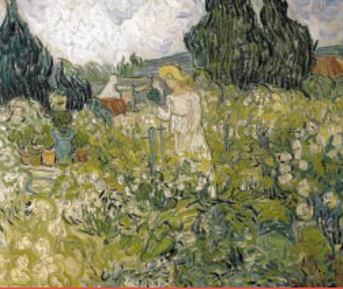
«Mademoiselle Gachet au jardin » - Van Gogh