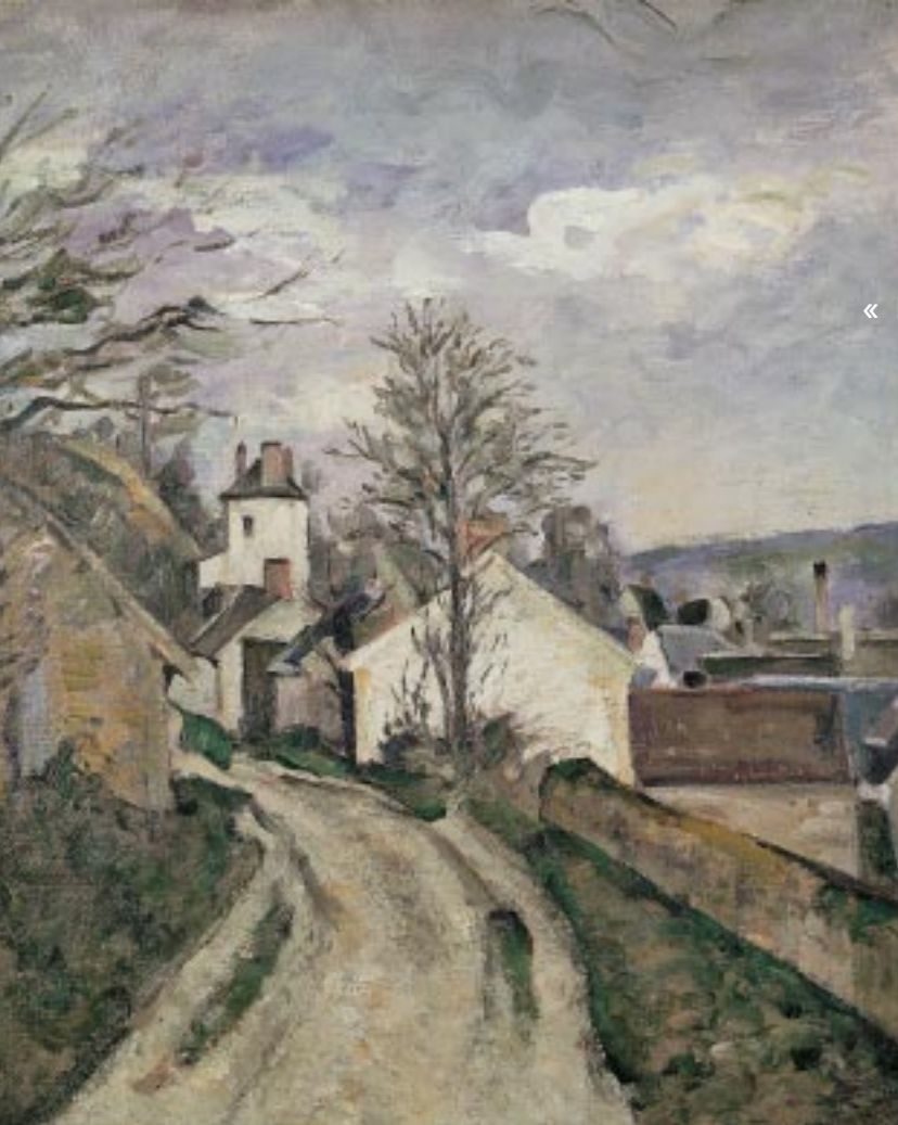
« La Maison du docteur Gachet » - Cézanne