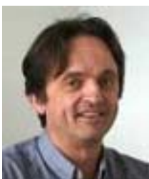
Chargé de mission national, Coordination du plan national d'actions Agence Nationale de Lutte Contre l'Illettrisme

http://www.fpp.anlci.fr/index.php?id=actions_educatives_familiales