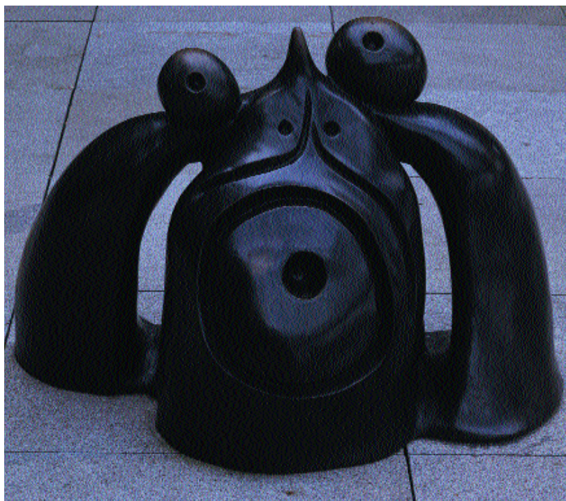
◀ Femme oiseau , 1974, de Joan Miró.

Cet hybride, tout en rondeurs et en cavités, réunit de manière magistrale des thèmes récurrents chez Miró : la femme et l'oiseau.